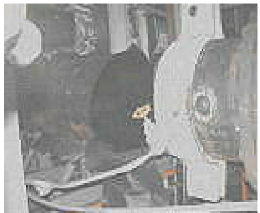
(横から見ると、バカッと開いた口)