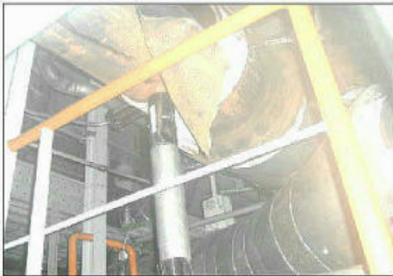
(すさまじい配管の大破断 - 下から覗く)

8月9日、若狭の原発美浜3号炉で、配管が大破断するという大事故が起こりました。5名の作業者が亡くなり、5名の方が病院で治療を受け、1名が自宅療養されています。